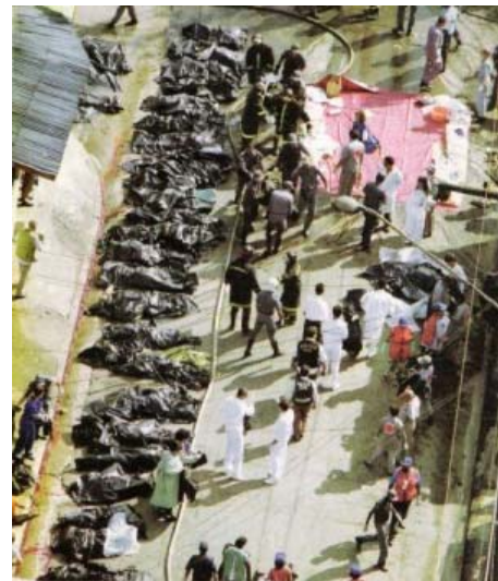
Figura 1 – Corpos recuperados no acidente com o Fokker 100 da TAM em 1996.

Conforme descrito em LEITE et al (2011) [2], diversos acidentes aéreos de grandes proporções marcam a história recente do nosso país, começando pela queda do Fokker 100 da TAM no aeroporto de Congonhas, em 1996 (Figura 1), com 99 vítimas fatais, seguido pelo voo GOL 1907, em 2006, com 155 vítimas fatais, voo TAM 3054, em 2007, com 199 vítimas fatais, voo Air France AF447, em 2009, com 228 vítimas fatais, além dos desastres naturais descritos em BRASIL (2014) [1], como os deslizamentos na região serrana do Estado do Rio de Janeiro, em 2011, com mais de 900 vítimas fatais e o incêndio na Boate Kiss na Cidade de Santa Maria no Estado do Rio Grande do Sul, em 2013, com 242 vítimas fatais.